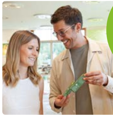
Duft- & Naturkosmetikshop

Der Duft- & Naturkosmetikshop ist von 8.30 – 18 Uhr für Sie/Euch geöffnet.